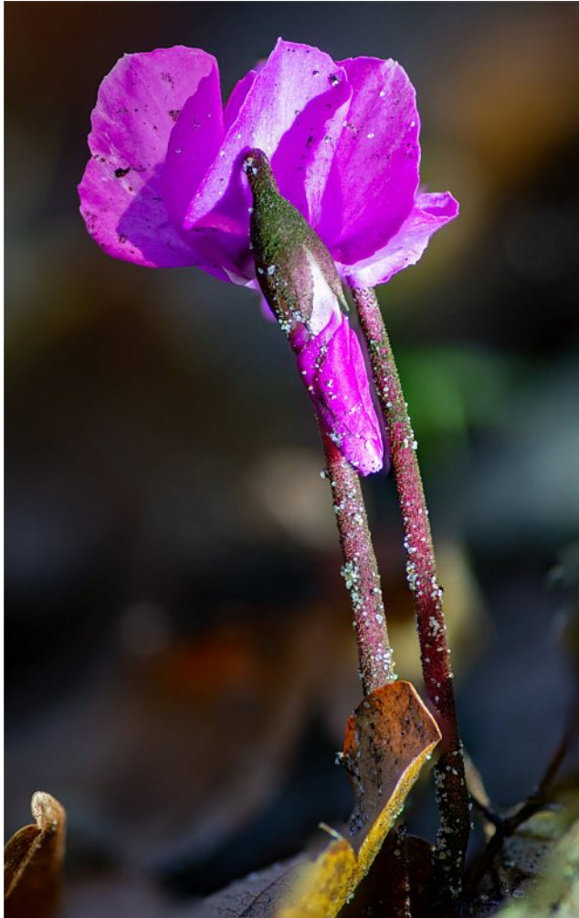
Cyclamen hederifolium Aiton

Cyclamen kunnen verschillende decennia leven. Er werden honderdjarige exemplaren van Cyclamen hederifolium gevonden, die in de 19e eeuw geplant werden en waarvan de knol een doorsnede van 30 cm had en meer dan 15 kg woog.