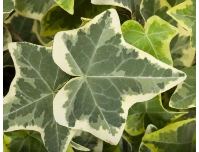
Klimop - Hedera